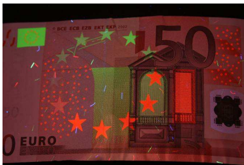
Fluoreszenz eines 50-EUR-Scheins